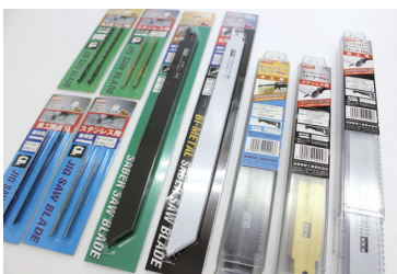
プロ用のジグソーブレードとセーバーソー