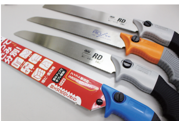
切ってごみ分別! プラマソー

はさみで切れない段ボールやカーペット、金属など硬い素材にやきもきしたことはないだろうか。そんな時にまさかのこぎりで切ろうという発想に至ることはまずなかっただろう。しかし、あらゆる素材に対応し、あざやかに切ることができるのこぎりが誕生した。