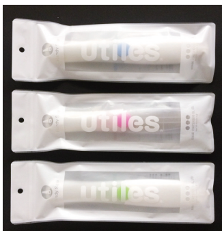
使ったあとまたしまいたくなる可愛いパッケージ