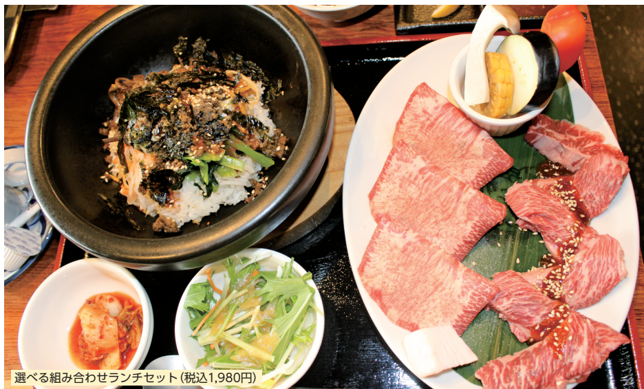
選べる組み合わせランチセット (税込1,980円)