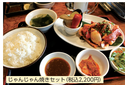
じゃんじゃん焼きセット (税込2,200円)