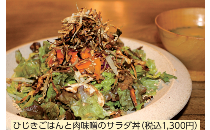
ひじきごはんと肉味噌のサラダ丼 (税込1,300円)