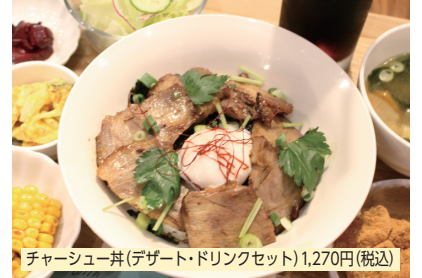
チャーシュー丼(デザート・ドリンクセット)1,270円(税込)