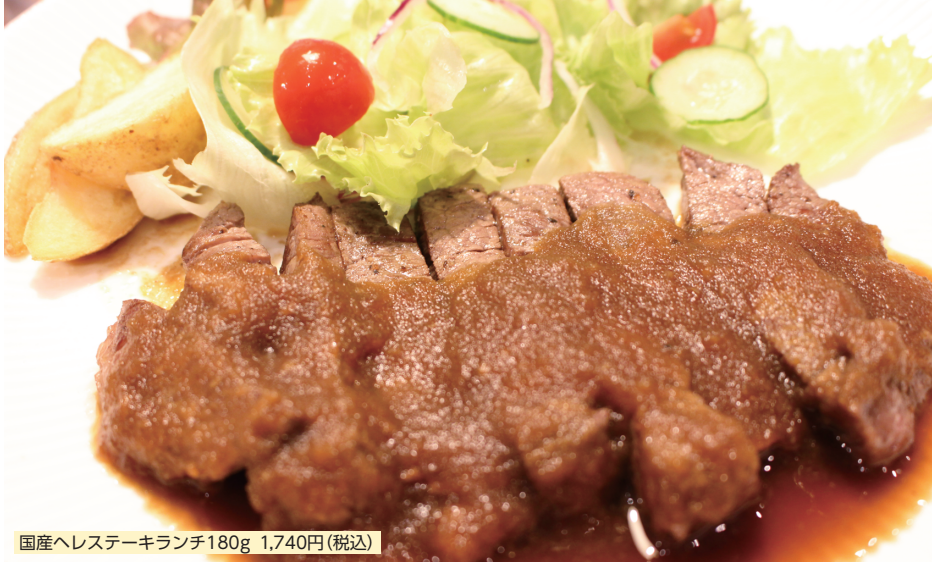
国産ヘレステーキランチ180g 1,740円(税込)