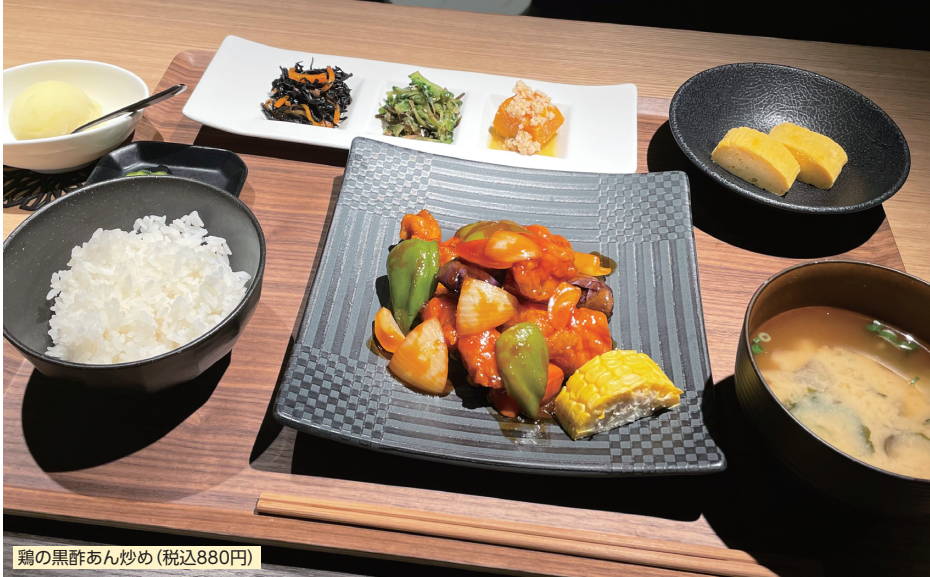
鶏の黒酢あん炒め (税込880円)