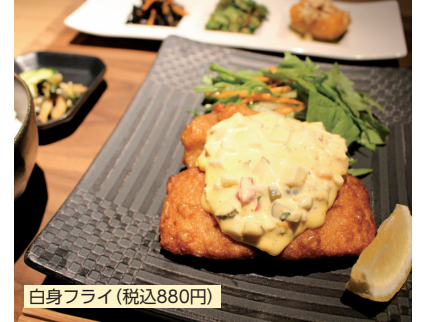
白身フライ (税込880円)