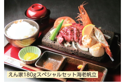
えん家180gスペシャルセット海老帆立