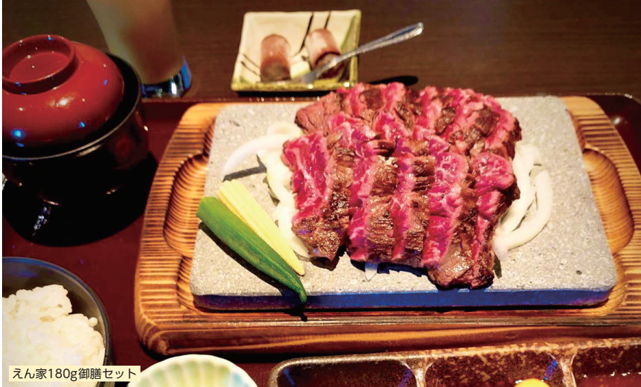
えん家180g御膳セット