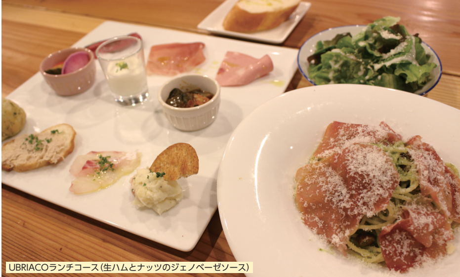
UBRIACOランチコース(生ハムとナッツのジェノベーゼソース)