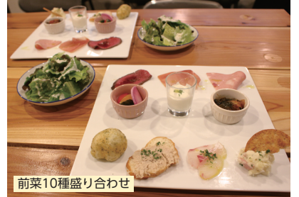
前菜10種盛り合わせ