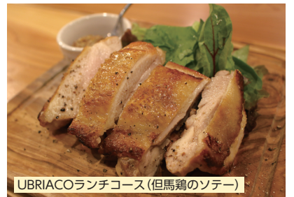
UBRIACOランチコース(但馬鶏のソテー)