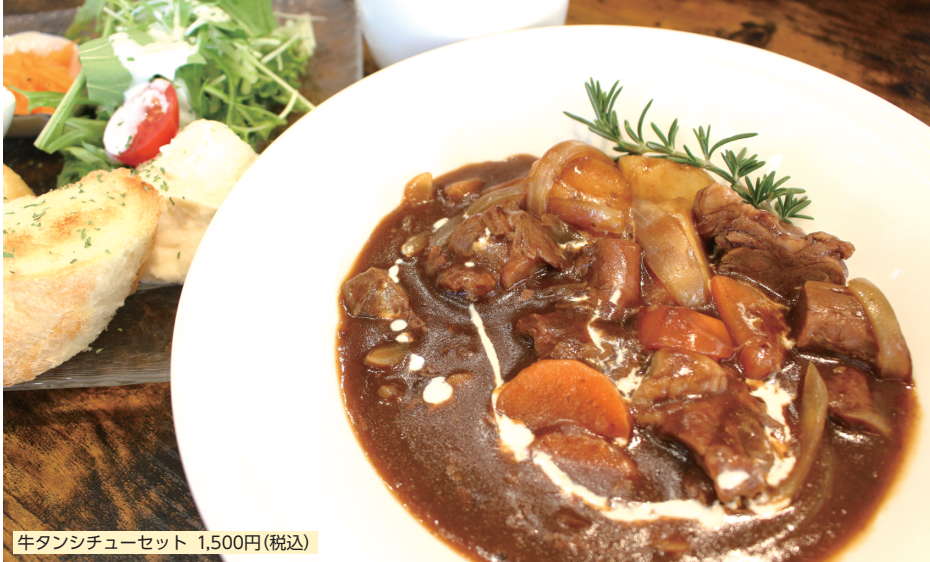
牛タンシチューセット 1,500円(税込)