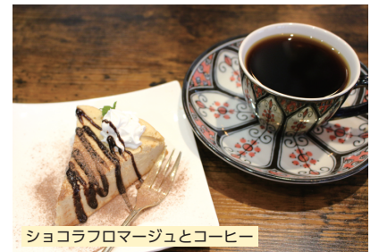
ショコラフロマージュとコーヒー

今年の2月に2周年を迎える「YScafe & space」さんをご紹介♪食事と趣味を楽しむお店です。元看護師のオーナーが栄養バランスを考えた“身体に優しい”メニューをラインナップ。いただいた牛タンシチューのセットはサラダ・スープ・ライスorパンがついて1,500円(税込)です。牛タンはスプーンで簡単にほぐれ、口に入れると想像以上の柔らかさ♪シチューには赤ワインをたっぷり使っているようで、最初はあっさり、赤ワインの風味が鼻に抜け、後からコクと甘みが口の中いっぱい広がる大人の味です。男性に人気のオム&ハンバーグは、サラダと、厚みのある卵のオムライス、野菜たっぷりのハンバーグがワンプレートに盛り付けられて1,100円(税込)。ケチャップなどの調味料をオリジナルブレンドしたデミグラスソースの香りに食欲がそそられます♪