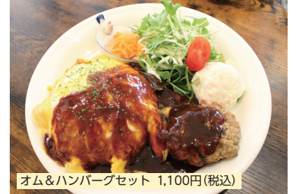
オム&amp;ハンバーグセット 1,100円(税込)