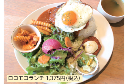
ロコモコランチ 1,375円(税込)