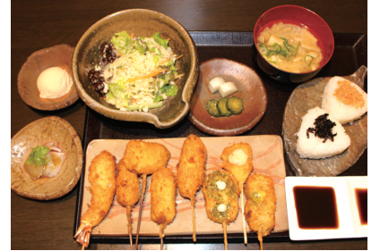
サービスランチ 1,100円(税込)