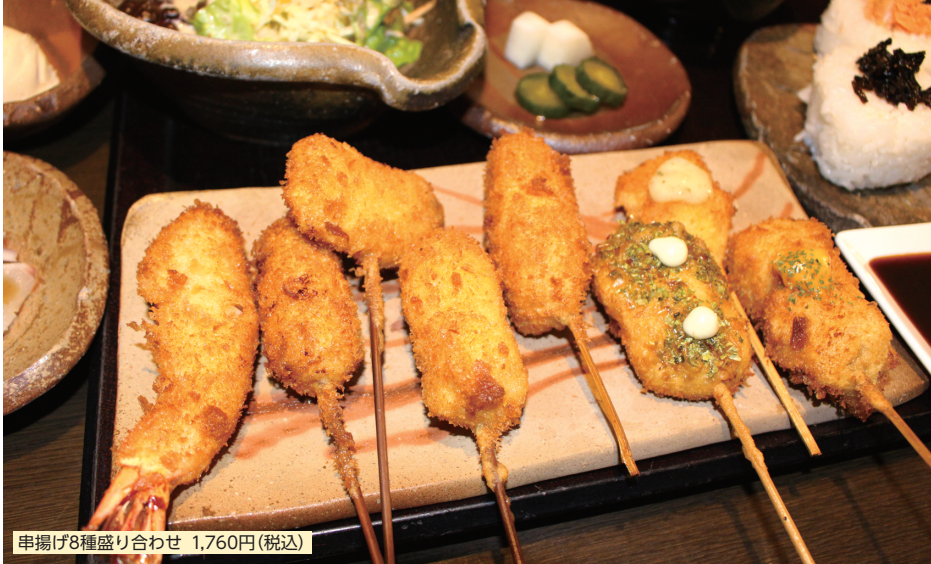
串揚げ8種盛り合わせ 1,760円(税込)