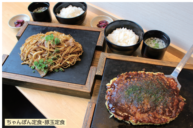
ちゃんぽん定食・豚玉定食