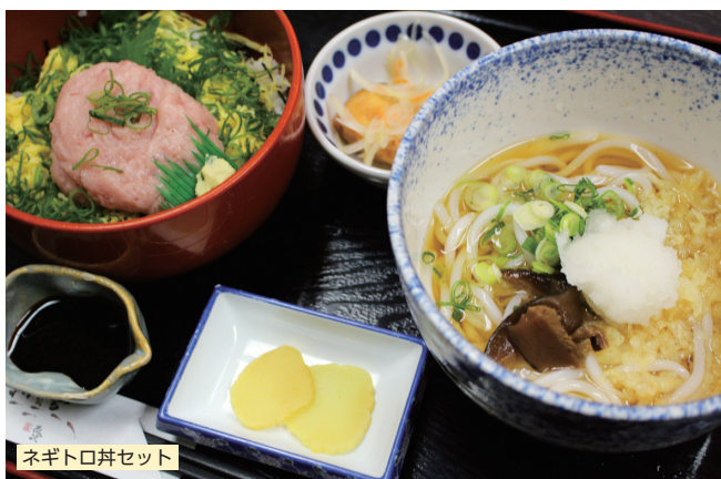
ネギトロ丼セット

米粉麺は、兵庫県産協会の選定する「平成30年度五つ星ひょうご」や、姫路市の「ものづくり開発奨励補助金」も受賞した製品です。店頭販売(税別750円)も行っていますので、是非一度ご賞味ください。「さめきうどん 琴 構店」さん、ごちそうさまでした!