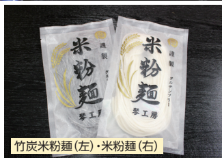
竹炭米粉麺(左)・米粉麺(右)