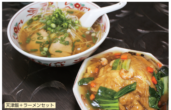
天津飯+ラーメンセット