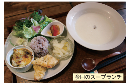
今日のスープランチ