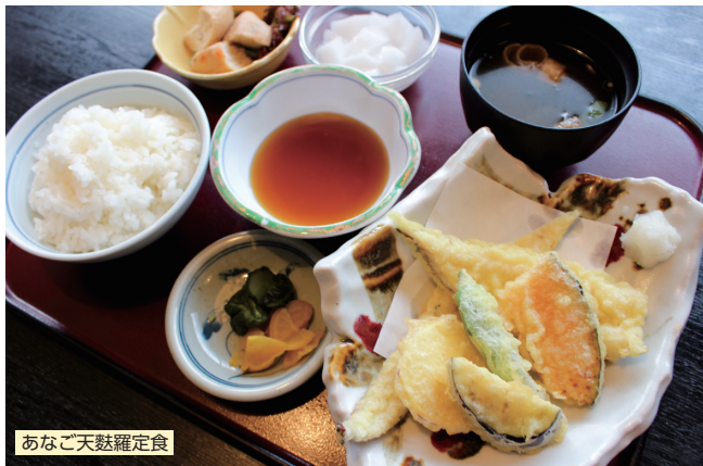
あなご天麩羅定食