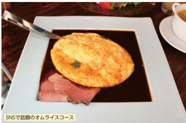
SNSで話題のオムライスコース