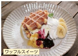
ワッフルスイーツ