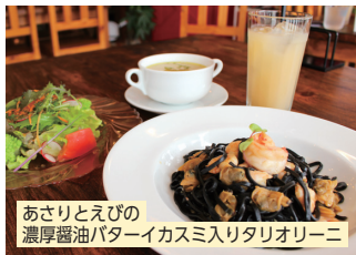
あさりとえびの濃厚醤油バターイカスミ入りタリオリーニ