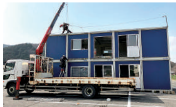
ユニットハウス設置の様子

ご・こうべ女性活躍推進企業（ミモザ企業）」に認定されました。さらに、健康診断のフォローを徹底するなど社員の健康管理にも注力し、「健康経営優良法人（中小規模法人部門）ブライツ500」に3年連続で認定されています。