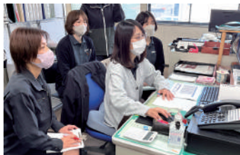
DX・AI推進ミーティングの様子