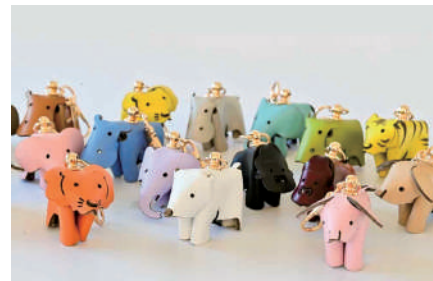
姫路レザーを使ったアクセサリー