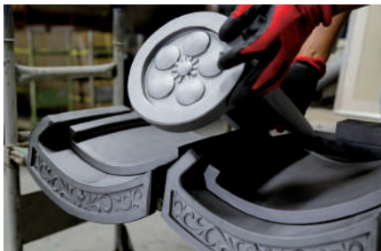
職人の手で仕上げる、伝統のいぶし瓦

いぶし瓦を「来て、見て、触れて」知ってもらうため、次世代への啓発活動と観光事業を推進しています。工場見学や製造体験を通じて、地元の子供たちが土に触れながら伝統技術を学ぶ場を提供し、瓦文化のファンを育成しています。また、敷地内には瓦屋根の魅力を肌で感じられるゲストハウス「薫銀別邸」や、地産地消の「CAFE koyo」を併設しました。宿泊、食事、製造体験を組み合わせた複合的なアプローチにより、瓦を身近な存在として認識してもらうとともに、瓦文化の魅力を発信していきたいと考えています。