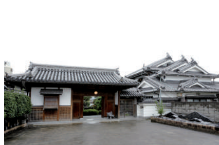
瓦の魅力を体感できる「薫銀別邸」