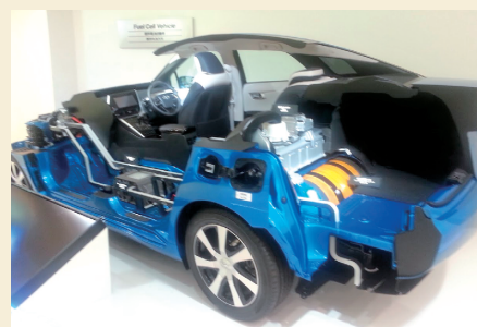
エポキシ樹脂が使用されている水素自動車