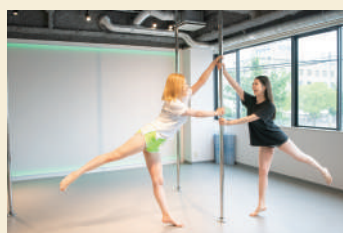
決まった振付はなく自由に表現を楽しむ