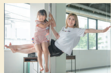
お子さんと一緒にできるレッスンも