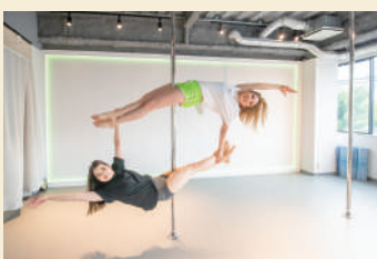
体幹・姿勢の改善にお役立ち

今後、5歳~小学生を対象にした親子クラス・キッズクラスを充実させたいです。1周年にはスタジオで生徒さんの発表会を計画中で、ゆくゆくは自主公演や地域のイベントへの参加を通じてポールダンスの魅力を広めたいです。