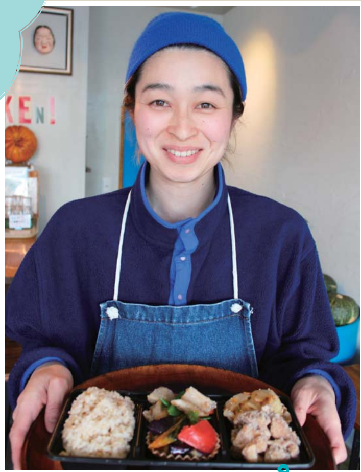
おまかせランチBOX 700円(税別)