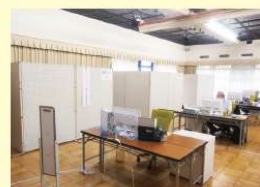
姫路商工会議所 本館1F展示場でも相談業務等に対応しています。

出勤職員の減少に伴い、ご利用の皆様にはご迷惑をおかけする場合もあるかと存じますが、新型コロナウイルスに関する事業所支援に取り組んで参りますので、ご理解のほどお願いいたします。ご来館の皆様には、マスク着用をお勧めするほか、かぜ症状はじめて体調のすぐれない場合にはご来館を見合わせていただきますようお願いいたします。