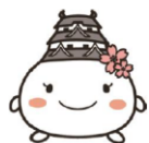
姫路市キャラクター しろまるひめ

8 働きがいと経済成長 働きがいと経済成長実現の一環として、雇用の創出やキャリアアップの明確化、業務改善や経営革新に取り組みます